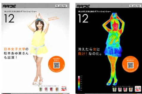
▲タダコピ誌面クリエイティブ(一部)

ミスキャンパス大集合! タダコピ超豪華企画 永谷園「冷え知らず」さんの生姜シリーズ 16大学×2タイプ(実写とサーモグラフィ) 計32種類のタダコピ