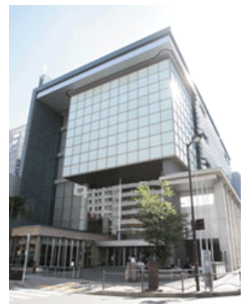
▲キャンパスプラザ京都 外観